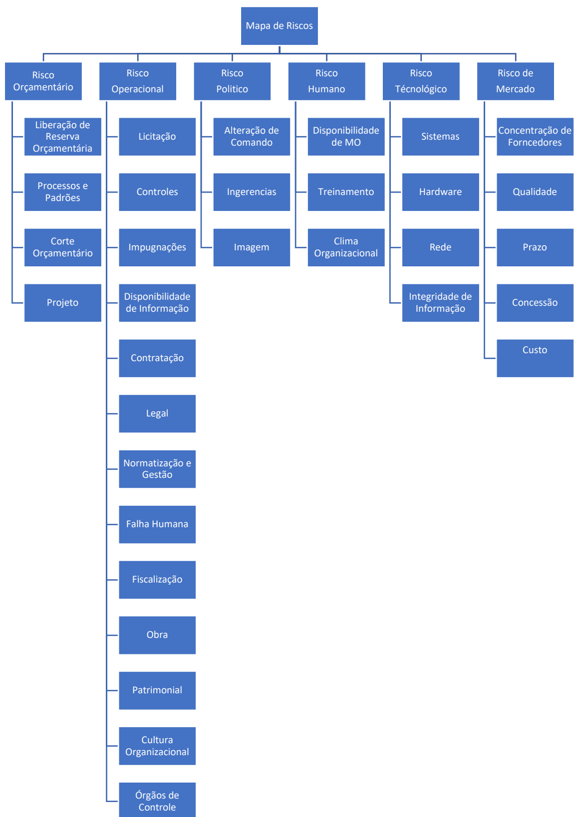
Figura 3 – Mapa de Riscos