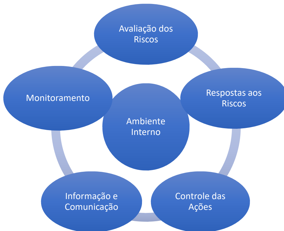
Figura 2 – Abordagem COSO