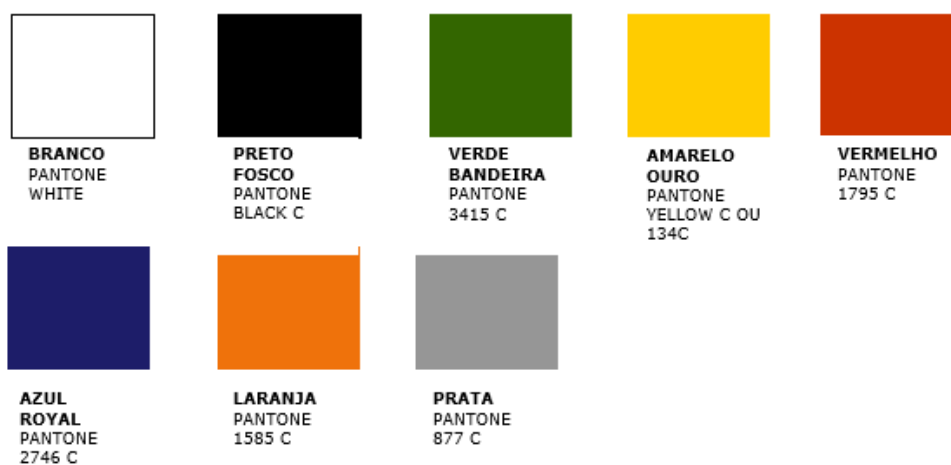
TABELA DE CORES - REFERÊNCIA PANTONE 2002/2003