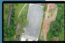
ORTOMOSAICOS ALTA DEFINIÇÃO