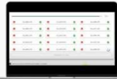
UPLOAD TURBO ARQUIVOS ZIPADOS