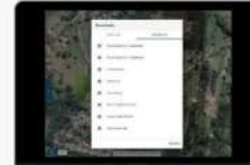
NUVEM DE PONTOS E CURVA DE NÍVEL